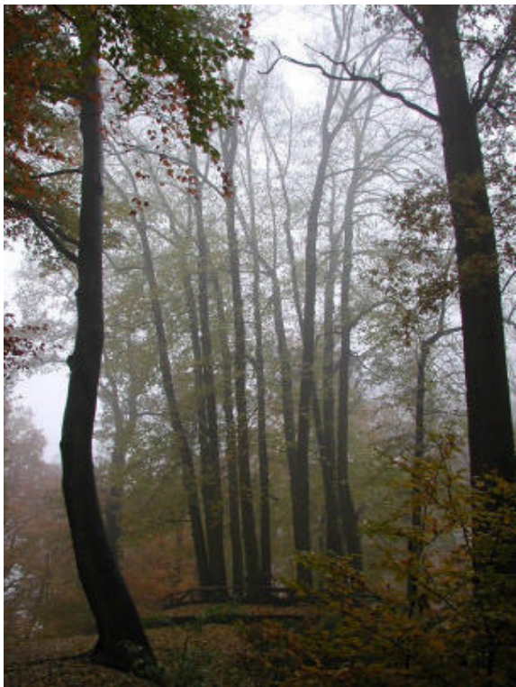
Afb. 2: De apostelengroep in Park Sonsbeek, anno 2002.

er nog geen huizen aan de Apeldoornseweg stonden kon men ver weg kijken van de eigenlijk ingetogen cirkel.