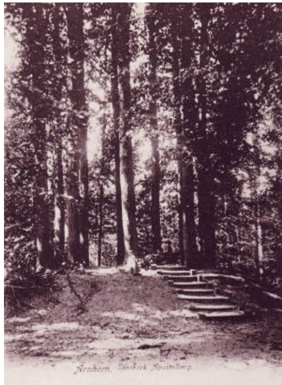
Afb. 3: Ansichtkaart van de Apostelenberg in Park Sonsbeek, anno 1905.

Centraal in het parkje vindt men een kleine boomcirkel die lokaal De Twaalf Apostelen wordt genoemd. Qua ouderdom lijkt de cirkel uit de eerste helft van de twintigste eeuw te zijn. Iedere boom zou van een andere soort zijn geweest. Te zien zijn tegenwoordig nog een kastanje, een linde en een haagbeuk, deels als boomruïne. Van de overige bomen zijn echter nog de stompjes over en inderdaad telt men bij elkaar twaalf bomen dan wel resten daarvan. Of er een boom ('Christus') in het midden van de cirkel heeft gestaan, lijkt onwaarschijnlijk.