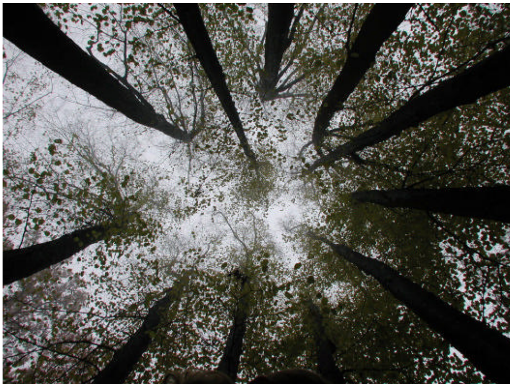
Afb. 4: Het dak van de apostelengroep in Park Sonsbeek.

De auteurs houden zich dan ook aanbevolen voor meer voorbeelden van het motief van de Twaalf Apostelen als boomcirkel of andere relevante informatie.