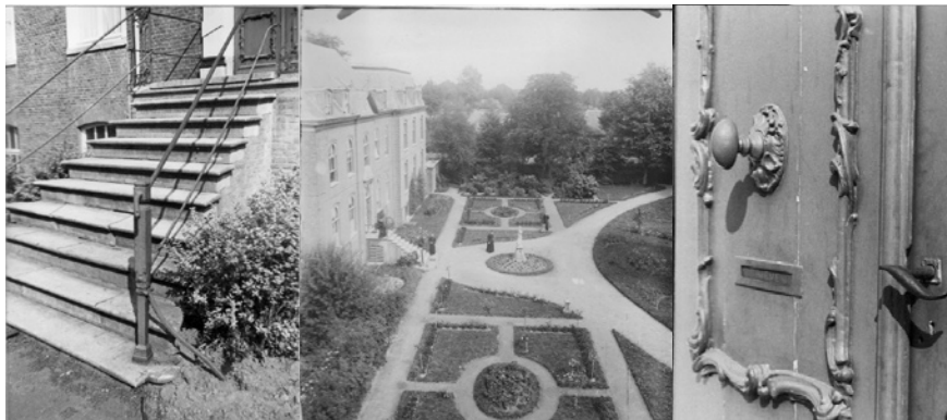
Neo-barokke parterre, centraal gelegen voor het Klooster Bijsterveld. Begin 20ste eeuw.

een breviertuin. Heel uniek voor een kloostertuin was op Bijsterveld een karakteristieke neobarokke siertuin langs de voorgevel van het huis, die op een foto uit 1918 is te onderscheiden.