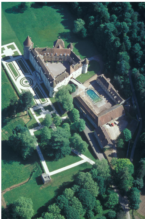
afb.1:Chateau Bazoches, ten zuiden van Vezelay, Bourgogne

Na deze kennismaking met Bazoches kreeg ik vorig jaar een foto van de kloostertuin van Klooster Bijsterveld (Oirschot) uit 1918 onder ogen. Klooster Bijsterveld is in 1903 gesticht door Franse gevluchte Monfortanen uit Saint-Laurent-sur Sèvre (ten zuiden van Nantes in de Vendée). Kasteel Oud-Bijsterveld is van middeleeuwse oorsprong, maar in 1772 opnieuw opgebouwd door de familie Sweerts de Landas. In de negentiende eeuw heeft het gebouw twee vleugels gekregen en later hebben de Monfortanen het huis verder uitgebreid en een kapel gebouwd. De kloostertuin is zoals vele kloostertuinen te beschouwen als enerzijds een boerenbedrijf en anderzijds een tuin met religieuze onderdelen, zoals een Mariagrot en