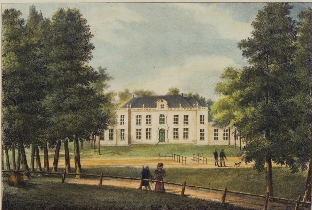
Chateau d'Enghuizen. à M le B de de Heeckeren.