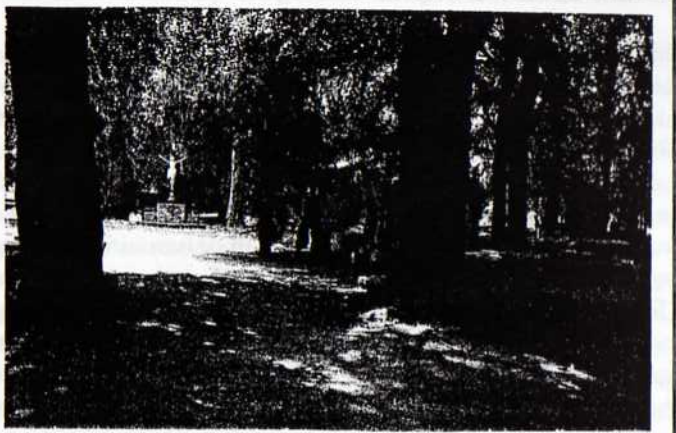
5. Het middenpad ter hoogte van vak 14, in zuidelijke richting gezien (foto auteur, juni 1995)

Op het ruim drie hectare grote ommuurde terrein wordt het beeld bepaald door hoge rode beuken en linden. 'De kronen van deze oude bomen overkappen ongeveer eenderde deel van het oppervlak. De tussenliggende open gebieden zijn doorsneden met bomenlanen