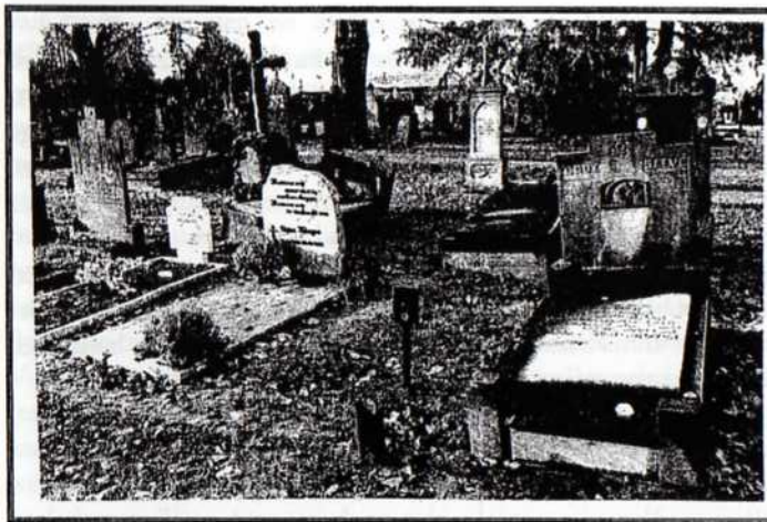
4. Overzicht van vak 9, gezien richting west