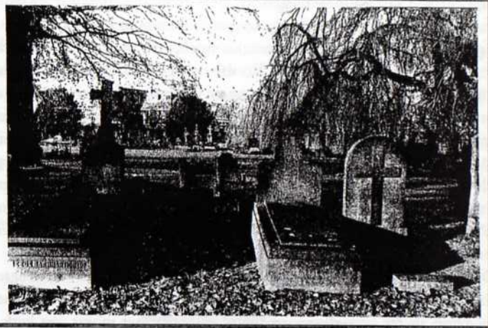
3. Vak 3 gezien vanaf het middenpad, met rechts een van de treurbeuken bij de ingang (foto auteur, nov. 1996)