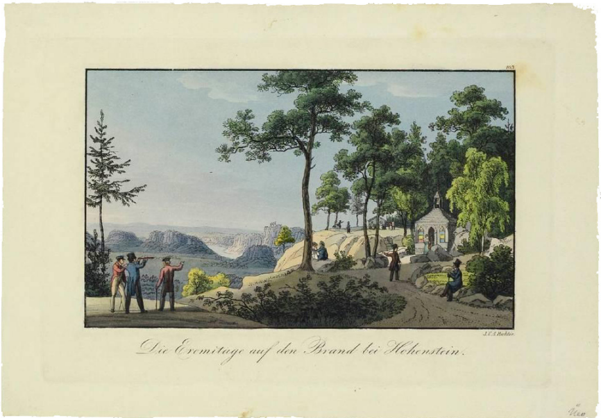
Afb. 3. J.C.A. Richter, Der Brand bei Hohnstein [...]. Gekleurde gravure, circa 1820. 13

In de achttiende en negentiende eeuw voorzag men tuingebouwen op een uitzichtpunt vaker van gekleurd glas zodat men afwisselend van de omgeving kon genieten alsof men in telkens veranderende seizoenen verbleef. De kleuren waren gewoonlijk rood of oranje, geel, groen en blauw. 14 Een grot in het Engelse Hawkstone was ermee uitgerust, diverse tuingebouwen en uitzichttorens in Duitsland en in Nederland bijvoorbeeld Calorama, Noordwijk en Heijenoord bij Arnhem.