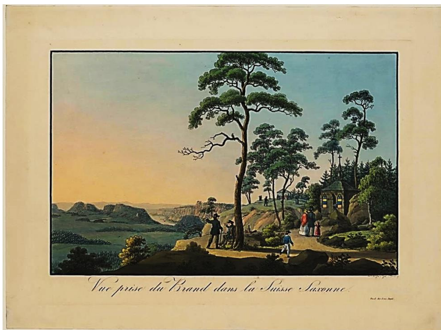
Afb. 2. Carl Heinrich Beichling, der Brand bei Hohnstein [...] mit einer Eremitage, einem gastronomischen Pavillon und der Aussicht nach Westen [...]. Gekleurde gravure, circa 1830. 9

Van Der Brand kunnen we ons een beeld vormen dankzij een kleurenlitho uit 1867, getiteld Der Brand bei Hohnstein [...] mit Blockhaus, Pavillon und Aussicht nach Südwesten [afb. 1]. Gustav Täubert maakte deze voor een prentenreeks van de streek. De 'schorsplaten' die Witte noemt, moeten we ons voorstellen als de aaneengehechte oppervlaktes van kurkschors of in dit geval dennenschors, die in heel Europa zo populair waren in het derde kwart van de negentiende eeuw. Witte toonde later, in zijn Tuinen, villa's en buitenplaatsen uit 1876-1878 veel voorbeelden van wat blijkbaar bij hem ook een favoriete stijl was. Redelijk exacte benoeringen en waarderingen van de rustieke stijl uit die tijd zijn zeldzaam – blijkbaar was het alledaags. 8