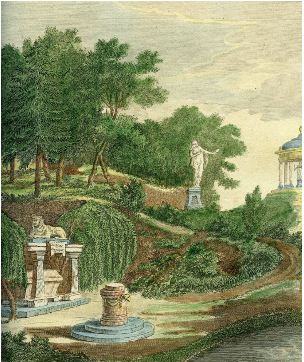
Een landschap met tombe en sfinnx