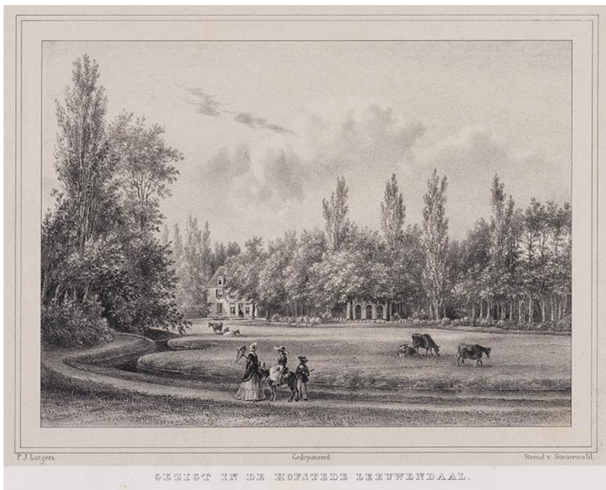
Leeuwendaal in Rijswijk. Litho door P.J. Lutgers, 1855

Waren de verdwenen tuinen die we tegenwoordig van belang vinden voor een goed begrip van de Nederlandse tuingehiedenis, in hun eigen tijd wel zo invloedrijk als wij veronderstellen? Of waren er andere, die we nu niet of nauwelijks meer kennen, die in hun tijd de toon aangaven als het ging om nieuwe trends in de tuinarchitectuur, hun betekenis of plantverzamelingen? Hetzelfde geldt voor tuinen die juist niet origineel waren, maar voor ons een goed voorbeeld zijn van de dagelijkse praktijk van aanleg, gebruik, onderhoud en representatie van tuinen in het verleden, juist omdat ze van een type zijn dat veel voorkwam. Wat zijn de verschillen in 'beleving' en waardering van een nadien verdwenen tuin, enerzijds door een tijdgenoot die erin rondwandelde en anderzijds door ons, die deze in woord en beeld weer tot leven trachten te wekken?