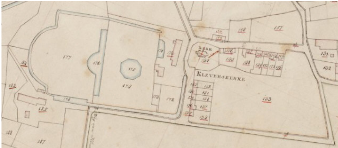
Afb. 5. Kadastraal minuutplan van Kleverskerke, 1820