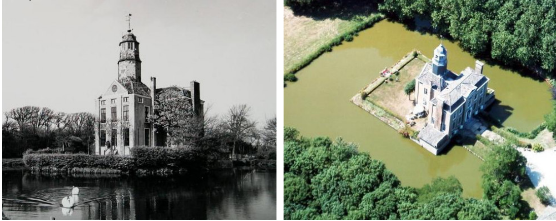
Afb. 4. Het huis Duinbeek