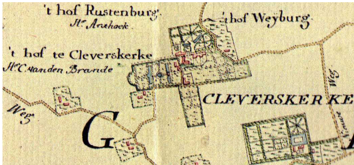
Afb. 2. Detail van de kaart van Walcheren door D.W.C. en A. Hattinga uit 1750

Hij had echter al eerder een tuin aangelegd. In 1687 verzocht Van den Brande toestemming “om seker eijnde wegs aen desselfs parochie met een boom op te sluijten, ten eijnde de plantagie bij sijn Ed. daar gemaakt niet mogte worden verhinderd”. Hij wilde als compensatie een nieuw stukje weg aanleggen. De datering van dit verzoek lijkt moeilijk te rijmen met de aankoop van de stukken land, met name van de boerderij. Het ligt niet voor de hand dat de tuinaanleg van de buitenplaats zelf in gang was gezet nog voordat Van den Brande de benodigde gronden had verworven. Hier zal nader onderzoek mogelijk meer licht op kunnen werpen.