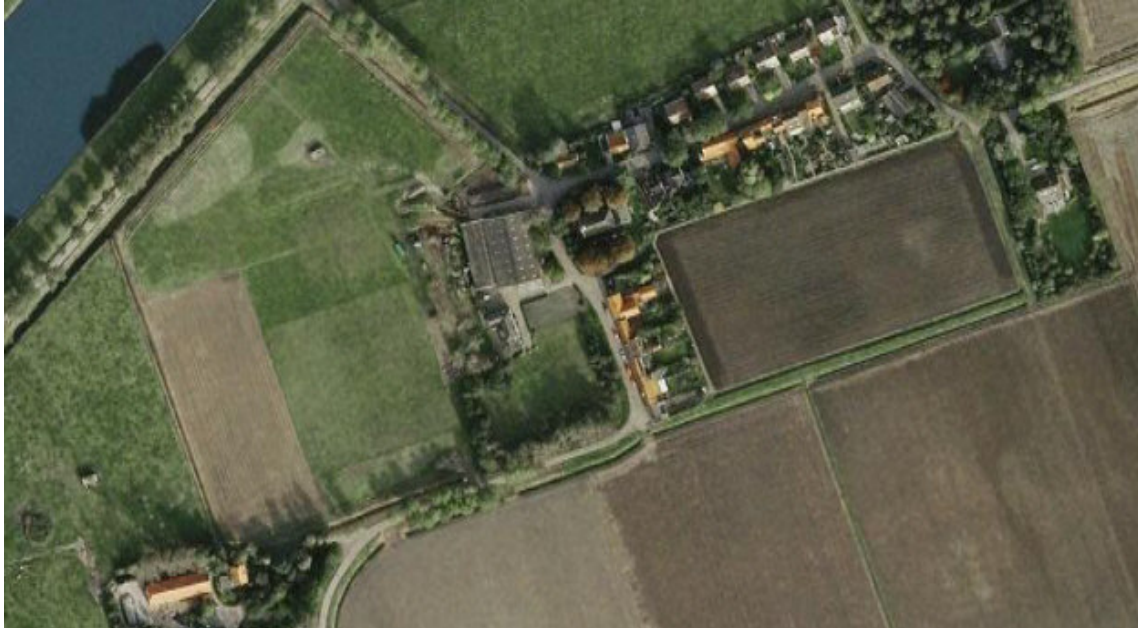
Afb. 6. Luchtfoto van Kleverskerke, 2008

nog bestaande overblijfselen van deze buitenplaats: ze tonen iets over de relatie tussen stad en platteland in de zeventiende en achttiende eeuw. Het bovenstaande is geen volledig overzicht van de geschiedenis van de buitenplaats te Kleverskerke. Er zou nog veel meer over gezegd kunnen worden; dit was slechts een greep uit de gevonden bronnen. In ieder geval heb ik met deze bijdrage de gevonden kaarten iets meer diepgang willen geven. Aanvullingen zijn welkom.