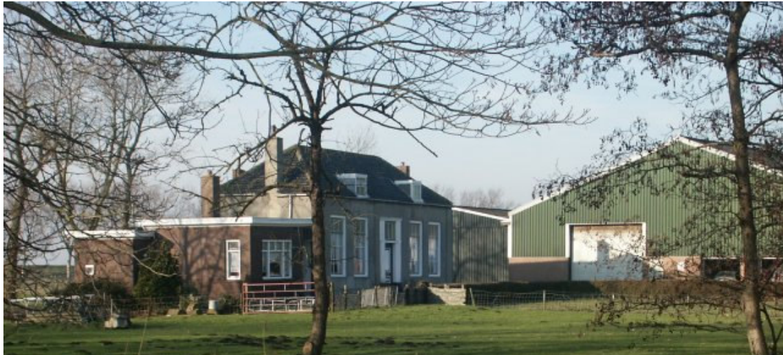
Afb. 3. Het nog bestaande restant van het herenhuis

Het huis bestaat tegenwoordig nog gedeeltelijk: een ondiep gebouw met een deur in het midden en aan weerszijden twee grote ramen. Het middengedeelte springt licht vooruit en op de hoeken zitten pilasters. De grijze bepleistering is mogelijk negentiende-eeuws en was in die tijd een typisch kenmerk van woonhuizen op het Walcherse platteland.