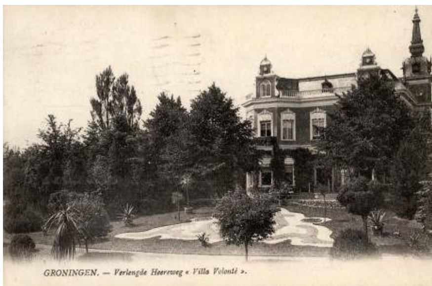
Villa Volonté, oude Ansichtkaart met mozaïekperk (1986-03016) 1920