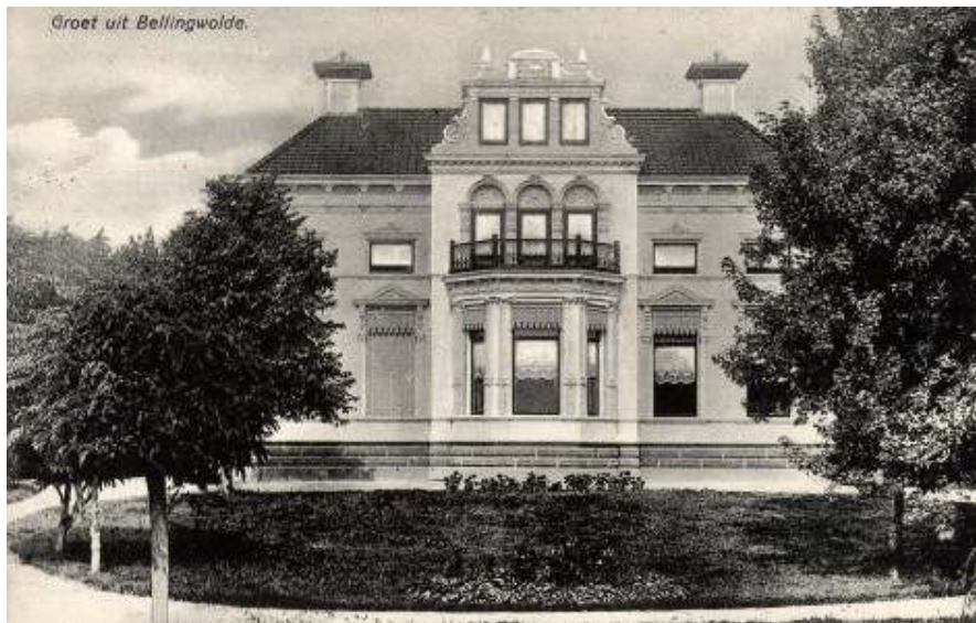
Boerderij Botjes, oude ansichtkaart (1986-09757) (ca. 1908)