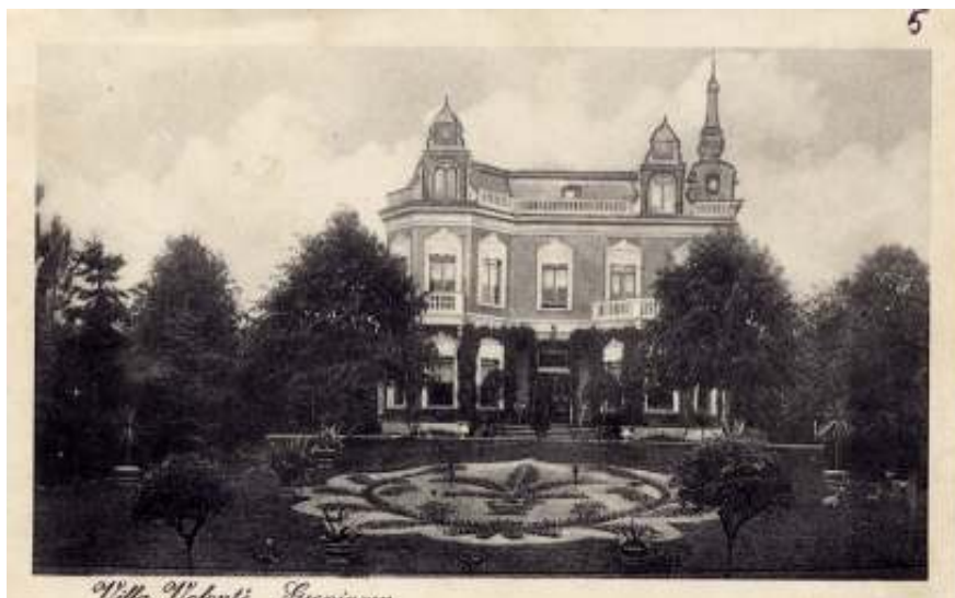
Villa Volonté, oude ansichtkaart met mozaïekperk

Verbluffend is dat binnen één geslacht soms wel 10 tot 20 verschillende soorten werden toegepast: voor de tuin van notaris Hofstede in Grootegast werden 10 verschillende soorten eiken besteld en voor de tuin van villa Hilghestede 17 soorten esdoorns. Anders dan in het begin van de late landschapstijl worden steeds meer coniferen aangeplant en niet alleen taxus en moerascypres, maar ook den en larix, thuja en jeneverbes, cypres, ginkgo en zilverspar vinden hun weg naar de grote tuinen. Tenslotte, vaste planten komen maar op drie rekeningen voor; bij villa Volonté is sprake van "25 vaste planten" en we moeten maar raden welke bedoeld zijn. Voor villa Hilghestede worden meer vaste planten genoemd waaronder, opvallend genoeg, een aantal gras-achtigen, zoals Bambusa , Arundo , Eulalia en kafferkoren ( Andropogon formosus ). Voor de tuin van Vredenburg (het latere Huize Tavenier) zijn er vele met naam en toenaam genoemd zoals o.a. Campanula's , riddersporen, anjers en daglelies.