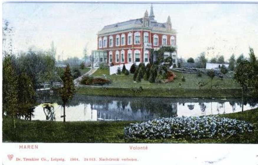
Villa Volonté, oude Ansichtkaart in kleur (1986-3015) (1904)